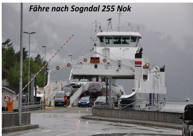
Fähre nach Sogndal 255 Nok

13.Tag 25.05 weiter durch den Laerdalstunnel 24,5 Km lang kostenfrei weiter zur Fähre Sogndal 255€ weiter E 16 E 5 zum Geiranger, durch sehr viele schmale Tunnels .Leider mussten wir umdrehen wegen Schneeverwehungen auf der Straße. Die Trollstigen können wir auch nicht befahren. Wir fuhren die 80 Km zurück zum Cp Grande Camping 220 Nok 23 € N61.89462° E07.10154° mit V/E +Strom Dusche 10 Nok Gefahren 260Km .