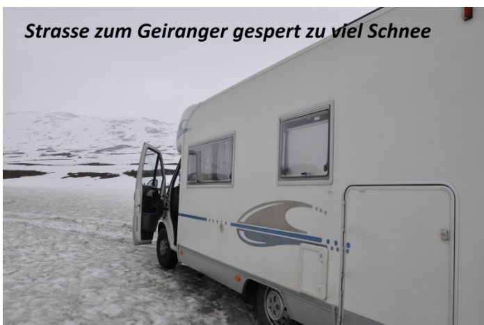
Strasse zum Geiranger gesperrt zu viel Schnee

14.Tag 26.05 müssen wir erst entscheiden wo es weiter gehen wird. Wir wollen unbedingt den Geiranger bezwingen und so fuhren wir auf der B650 nach Hellesylt zur Fähre. Wir warteten 1 Stunde und dann nahm die Fähre uns nicht mit weil sie voll war. Aber es war kein großes Malheur den die Fähre hätte 1300 Nok 130 Euro gekostet. Wir entschieden uns wieder zurück zu fahren